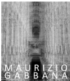
[Vedi la foto originale]

Daverio (VA) - dal 13 gennaio al 28 febbraio 2013 Maurizio Gabbana - Studio Dimensione