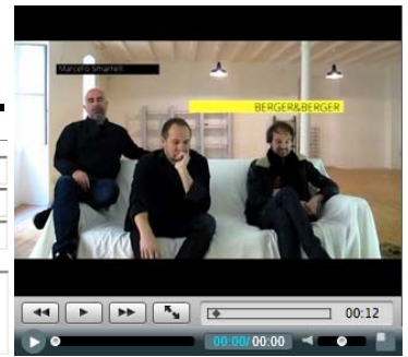
Berger&Berger, due fratelli uniti dallo spazio